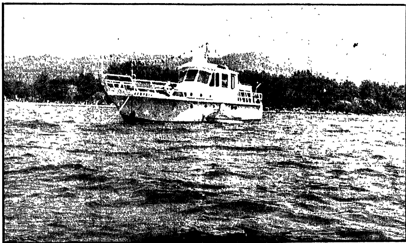
Il battello «Etruria» ormeggiato a poca distanza dalla riva del lago di Bolsena

L'«Etruria», la prima imbarcazione della società di navigazione, è ormeggiata a mezzo chilometro dalla riva, in attesa di togliere l'ancora - Contemporaneamente stanno iniziando alcune lottizzazioni - Una eccessiva espansione demografica rischia di inquinare il lago - Occorrono centoventi anni per il ricambio delle acque - Una denuncia di «Italia Nostra»