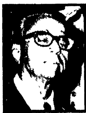
LA MALFA - Non ci sono soldi per le riforme