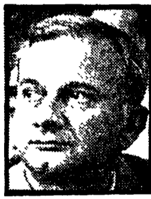
VIGNOLA - Impegni precisi e subito per il Mezzogiorno