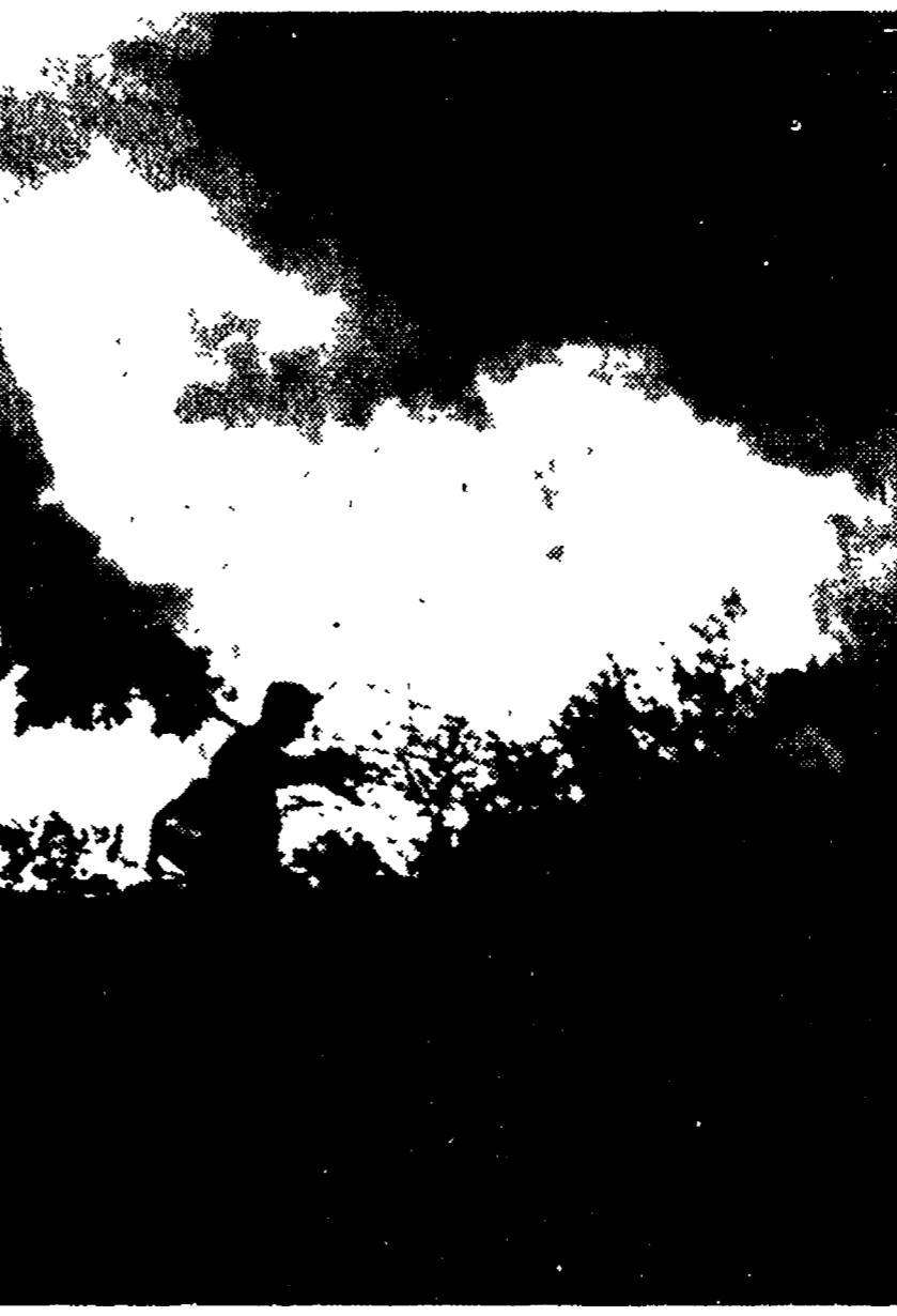
FIRENZE — Incendio sul monte della Calvana oltre Prato, sulla sommità del quale è sepolto Curzio Malaparte.

Fuoco a Barberino e Figline - Distrutta la vegetazione sul Fauto - A Venafro residui bellici saltano per il caldo