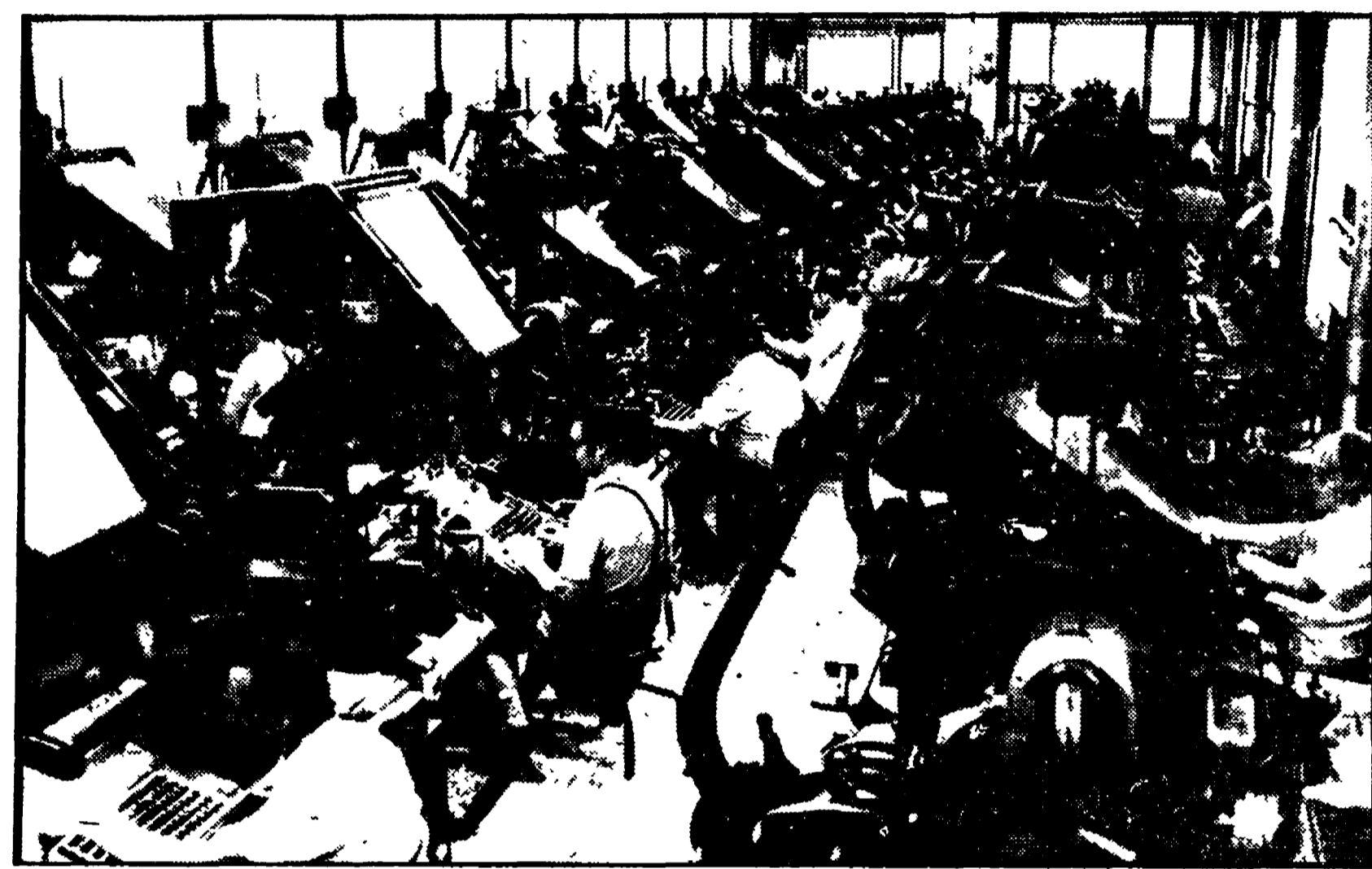
Dalla nostra redazione

Sarà in funzione una vera e propria redazione - Tutte le fasi di lavorazione del giornale potranno essere seguite per TV - Un «computer» risponderà alle domande dei visitatori