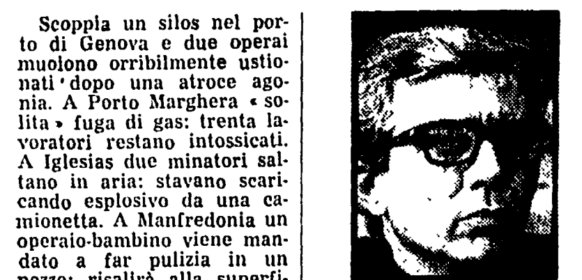
GIUNTI - Il movimento sindacale incalzerà padroni e governo