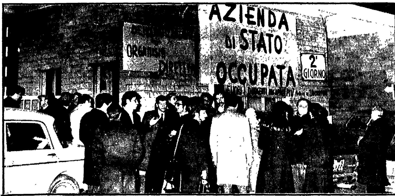
Un'immagine della lunga e tenace lotta condotta dai lavoratori dell'Istituto Luce

Nove dipendenti hanno sottoscritto due milioni per il nostro giornale