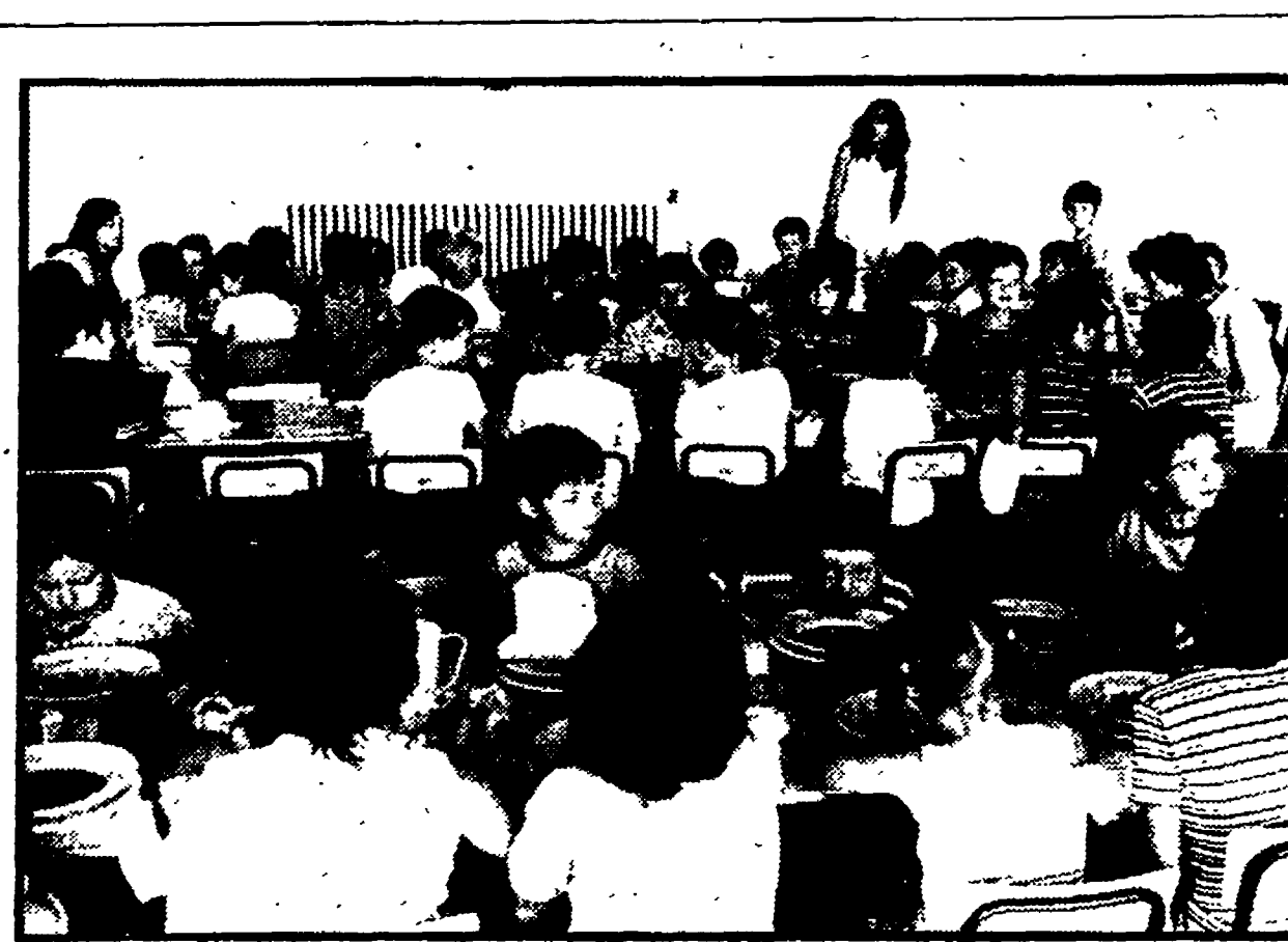
Centri estivi aperti fino al 15 settembre