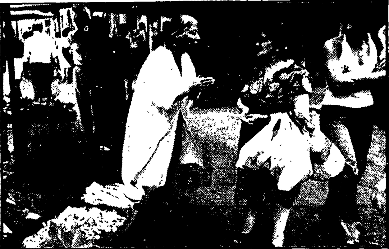
I rivenditori di pesce sono tra i più colpiti dalle conseguenze che ha avuto sul piano economico l'infezione di colera. Molti hanno smesso di vendere pesce, altri hanno deciso, per venerdì, di distribuire gratuitamente il pesce colto al più tranquillamente consumare. Iniziativa per convincere la gente a non disertare i mercati e le bancarelle dei rivenditori sono state prese in diversi centri della costa. Domani si svolgeranno a Civitavecchia, anche i pescatori di Anzio hanno deciso, per venerdì, di distribuire gratuitamente il pesce colto al più tranquillamente consumare. Iniziativa per convincere la gente a non disertare i mercati e le bancarelle dei rivenditori sono state prese in diversi centri della costa.

Da un lato La Morgia ha dunque evitato il discorso sulle responsabilità delle attuali carenze, imputabili ai modi di governo e di gestione del gruppo dominante dc provinciale. La denuncia della situazione è stata assai pesante. Circa il 20 per cento dei comuni mancano di impianti fognati, tutti i comuni escluso Roma - sono spro-