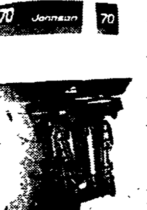
Il 70 cavalli 74 è il più potente 3 cilindri da 850 centimetri cubici sul mercato; è un ottimo risultato per un motore che era partito nel '69 con 55 cavalli e vede ora un incremento di potenza di ben 15 cavalli.