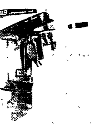
Il Johnson da 9,9 (o 15) cavalli, come si può vedere, assai compatto. Ciò consente di trasportarlo anche su auto di piccola cilindrata.