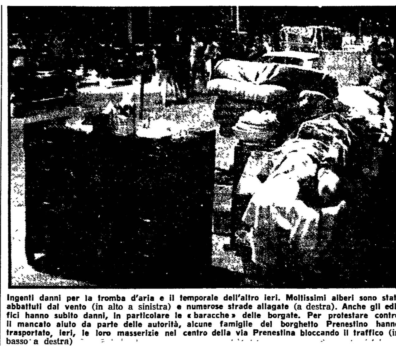
Ingenti danni per la tromba d'aria e il temporale dell'altro ieri. Moltissimi alberi sono stati abbattuti dal vento (in alto a sinistra) e numerose strade allagate (a destra). Anche gli edifici hanno subito danni, in particolare le «baracche» delle borgate. Per protestare contro il mancato aiuto da parte delle autorità, alcune famiglie del borghetto Prenestino hanno trasparato, ieri, le loro masserizie nel centro della via Prenestina bloccando il traffico (in basso a destra)