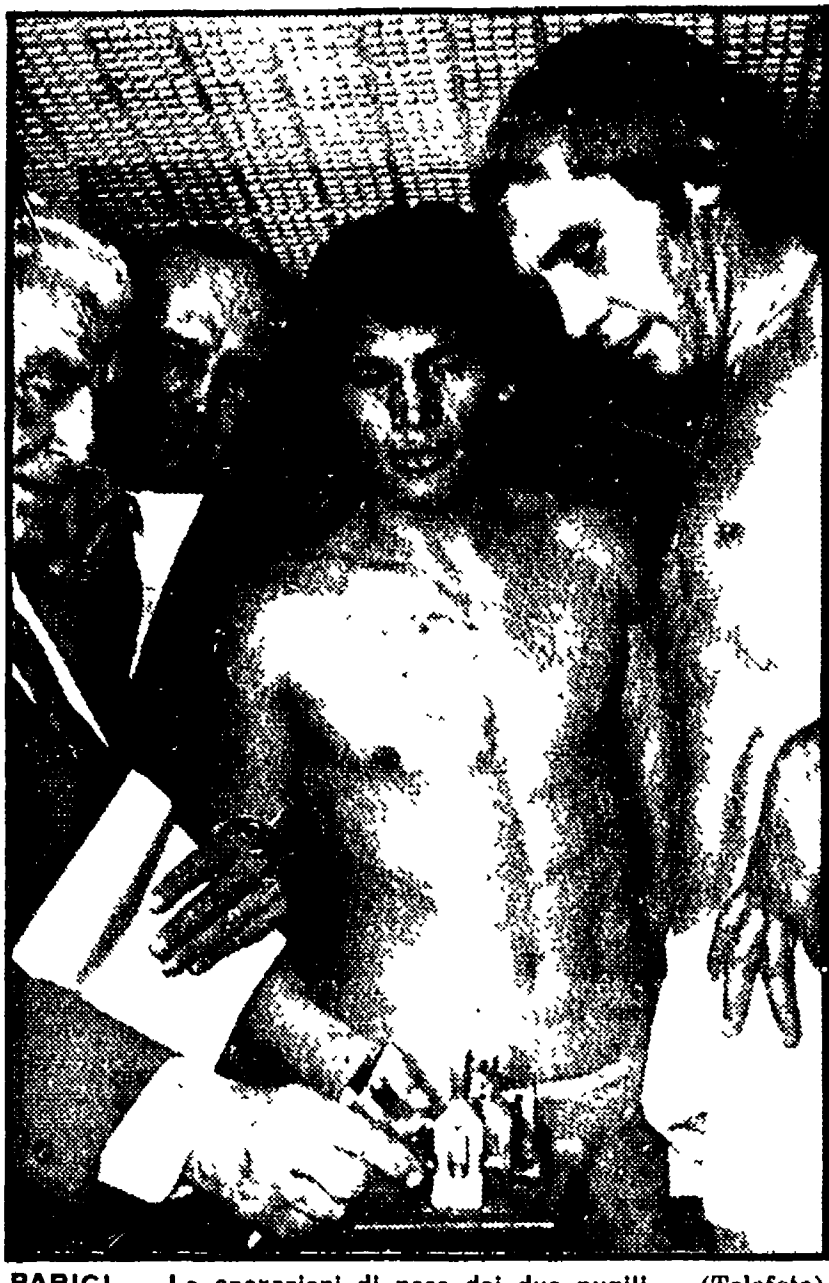
PARIGI — Le operazioni di peso dei due pugili

L'argentino è apparso, in diverse occasioni, piuttosto statico ed è stato messo alla frusta dallo sfidante che al termine della 11ª ripresa si trovava in leggero vantaggio di punti (grazie anche ad un richiamo ufficiale al campione) - Gli ultimi 4 round hanno visto l'intelligenza pugilistica di Monzon riflettere, mentre Bouttier è calato