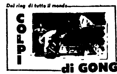
Dal ring di tutto il mondo

ziché far indietreggiare il campione con colpi fitti (è noto che Monzon non sa colpire quando indietreggia), ha voluto fare «testa a testa» e qui è stato pescato da un nuovo destro, per la verità non molto corretto (colpo alla nuca), che lo ha fatto vacillare e poi è finito al tappeto colpito da un altro gancio destro. Coraggiosamente il francese si è rialzato, ma ormai il match era per lui definitivamente compromesso, lo sorreggeva soltanto la volontà di non cadere definitivamente ai piedi del più forte rivale. L'ultima ripresa è stata un vero calvario per lo stoico pugile francese: centrato da un nuovo destro del campione, Bouttier è finito nuovamente a terra. Ormai era in balia di Monzon che o non ha voluto o non ha saputo concludere definitivamente, e così il francese è riuscito a terminare in piedi il match.