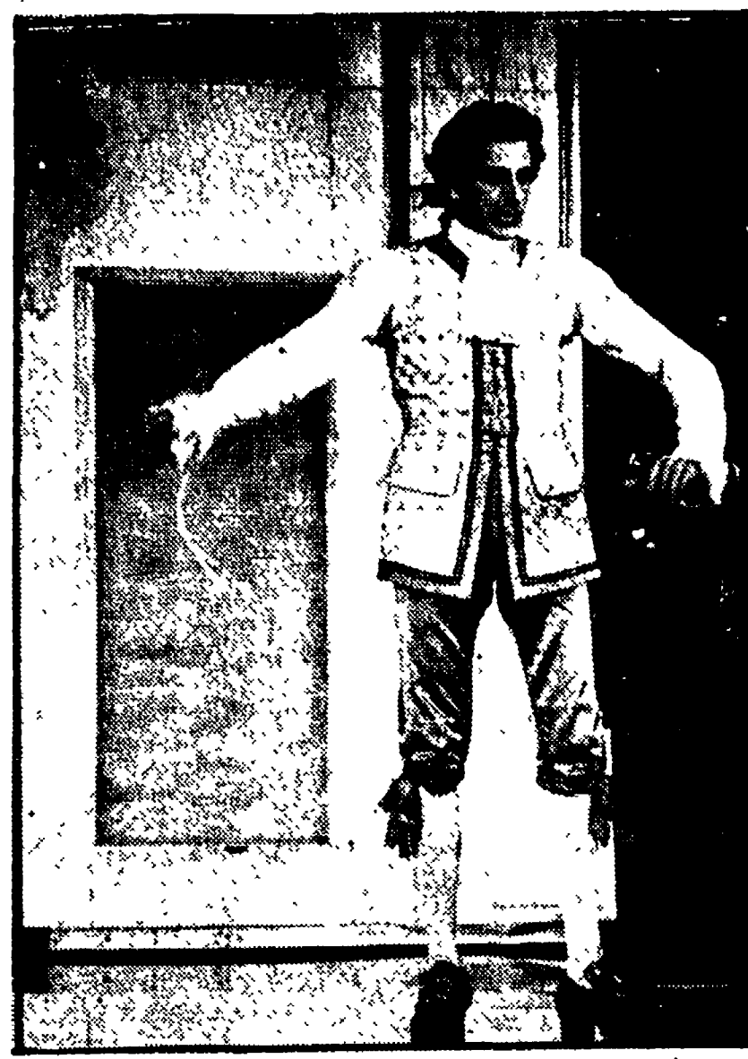
Visti i risultati, la scelta del Matrimonio di Figaro di Beaumarchais, da parte della compagnia di «Teatro Insieme»...

Un allestimento assai discutibile della compagnia di «Teatro Insieme» con la regia di Armando Pugliese