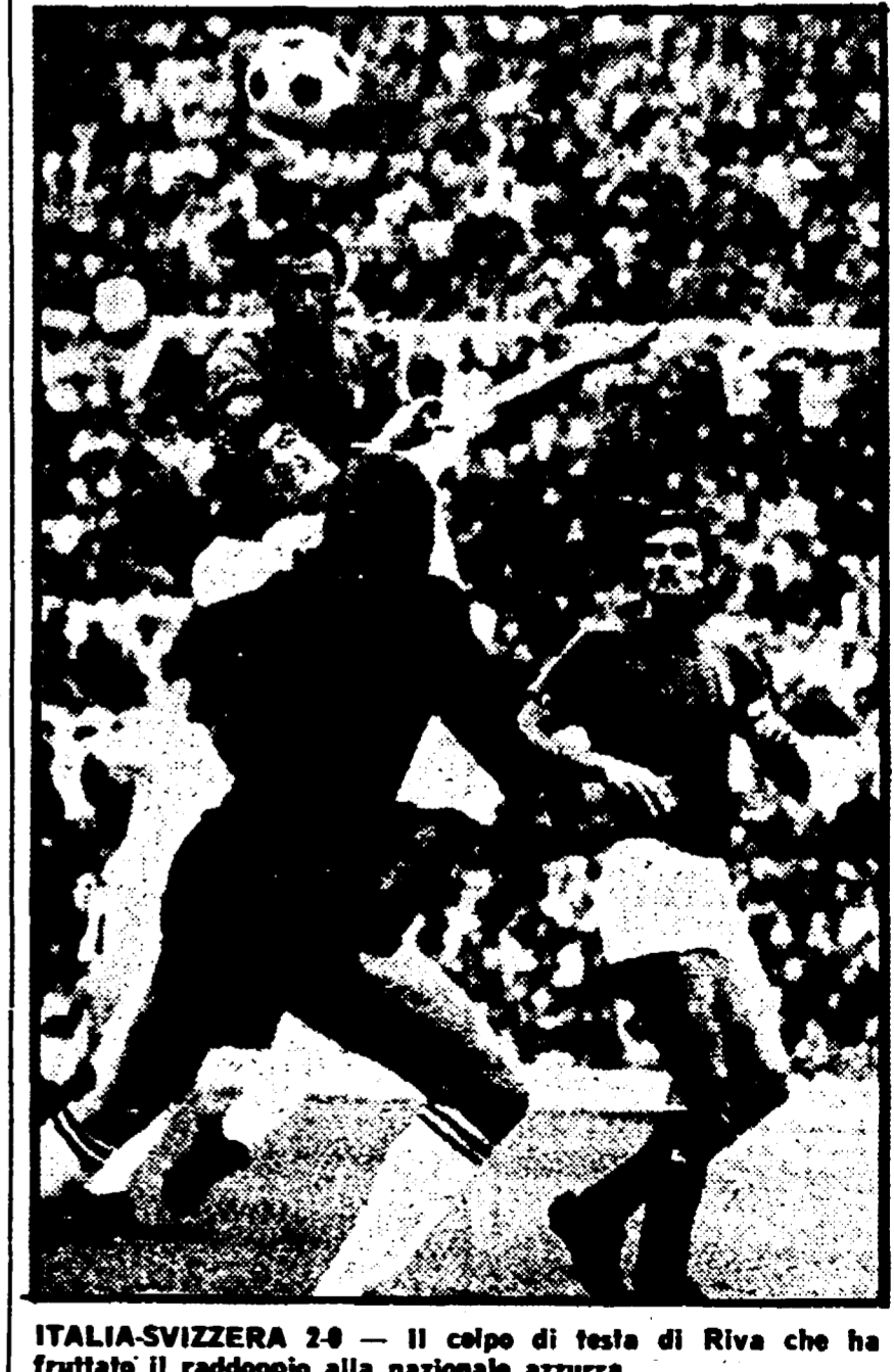
ITALIA-SVIZZERA 2-0 - Il colpo di testa di Riva che ha fruttato il raddoppio alla nazionale azzurra

CAUSIO (4+) - Sostituito a Rivera, si è trovato avvantaggiato dal gol più sicuro al sicuro, vendendo nella fascia destra e dando