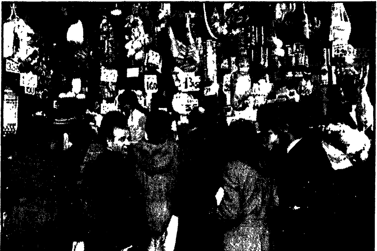
Coda davanti a un banco di piazza Vittorio per rifornirsi prima della fine del blocco

Code nei negozi e nei mercati in questi giorni non solo per via delle festività, ma soprattutto per accumulare provviste nel timore che, con lo scadere del decreto sul blocco dei prezzi, si abbiano immediati aumenti. Oggi è l'ultimo giorno; da domani dovrebbe cominciare la « fase due » della politica governativa, durante la quale continueranno a non essere ammessi incrementi nei prezzi dei generi interessati al blocco.