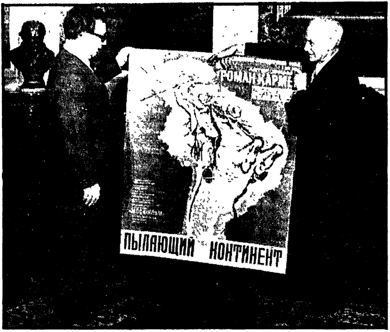
Dalla nostra redazione

Il commento di un comunista che ha vissuto la storica vicenda non da spettatore, ma da rivoluzionario - Fissato sulla pellicola un esaltante incontro con Allende