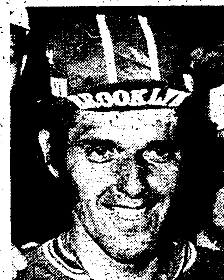
Roger De Vlaeminck

Quattro giorni di Dunkerque: 1. MAERTENS, p. 15; 2. Verbeeck, 10; 3.