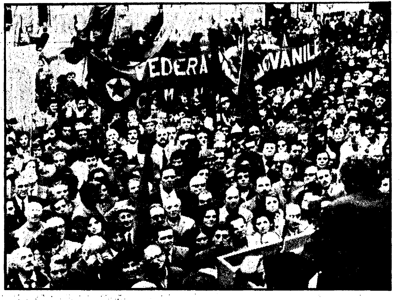
GENOVA - Un momento della manifestazione svoltasi prima della partenza della « Australe »

suolo le città nord-vietnamite, i portuali della capitale ligure boicottarono le navi americane. Ma alla Compagnia, unica dei lavoratori ci si chiese se il boicottaggio fosse sufficiente, se invece non ci si dovesse impegnare anche in un lavoro volto a curare alcune delle ferite che l'aggressore aveva aperto. Una domanda che ha ricevuto immediata risposta, in primo luogo dal Comitato Italia-Vietnam che ha lanciato la sottoscrizione nazionale a cui, a loro volta, hanno risposto organizzazioni sindacali e politiche, enti locali, gruppi di cittadini e anche singoli. Lo hanno dimostrato le scolaresche che negli ultimi giorni sono salite a visitare l'« Australe » offrendo i loro salvadanaï o anche quei cittadini che l'avevano fatto caricare sulla nave la sua utilitaria, perché - ha detto - di più non poteva dare. Così, poco per volta, si è formato il corteo che ha avuto un appuntamento alla Cooperativa Garibaldi - la stessa che mezzo secolo fa armò « L'Amilcare Cipriani » che portò alla Russia sovietica la solidarietà materiale del popolo italiano - sta portando ad Haiphong.