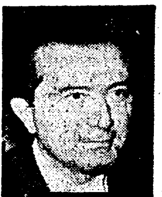
ANDREOTTI - Presioni di destra