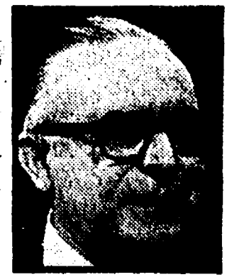
RUMOR - Preparazione del «vertice»