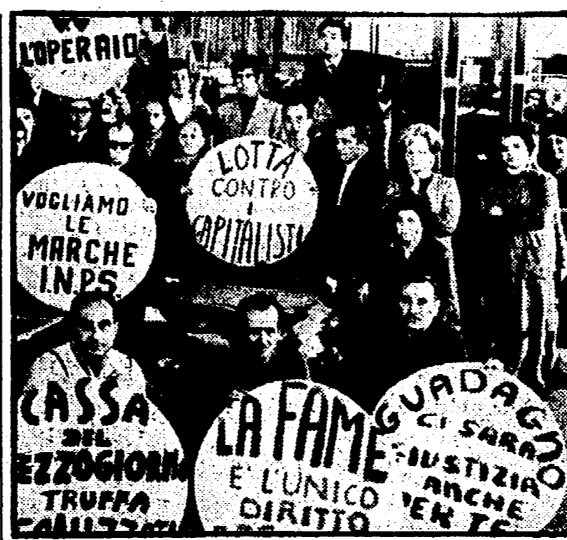
Gli operai della Veguastampa durante una manifestazione