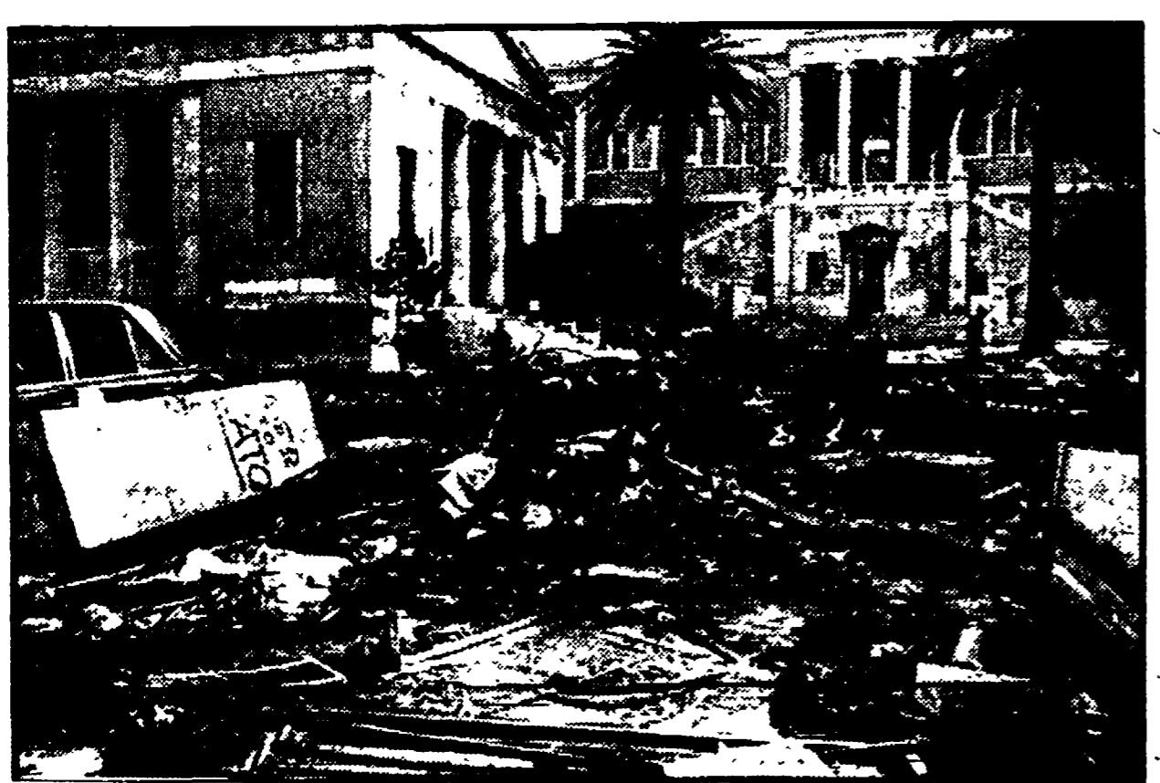
Un pullman distrutto dai carri armati nei pressi del Politecnico di Atene