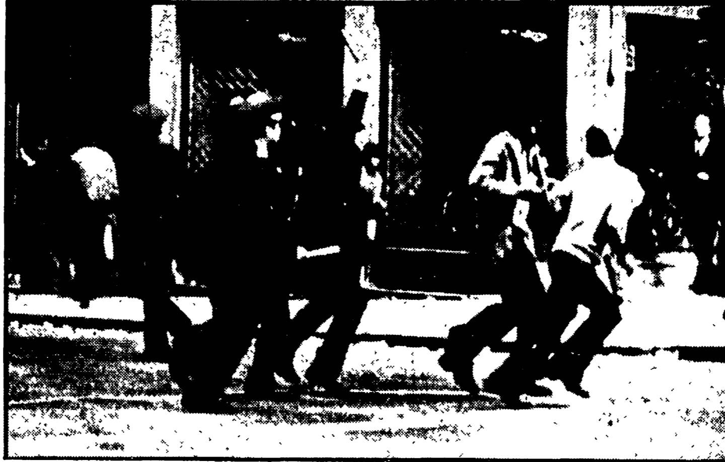
La polizia insegue e bastona giovani dimostranti