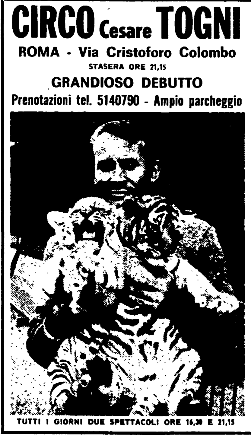
TUTTI I GIORNI DUE SPETTACOLI ORE 16,30 E 21,15

CINEMA PRIME VISIONI ADRIANO (Tel. 352.153) - Treppa rischio per un uomo solo (prima)