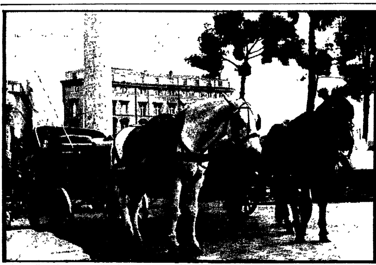
«Botticella» in attesa di clienti a piazza Venezia

Molti rivenditori, colti di sorpresa, hanno esaurito le scorte nel giro di poche ore - Si prospetta un aumento dei prezzi - Preferite le biciclette pieghevoli