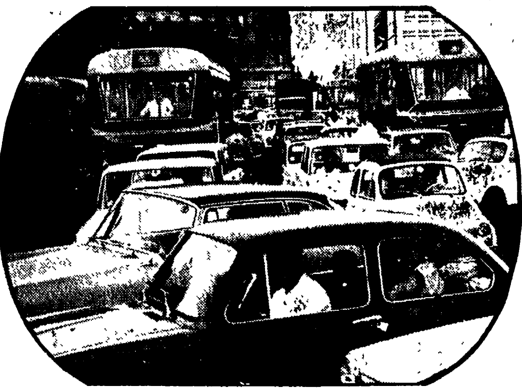
Autobus: le auto private, nei giorni feriali, bloccano il traffico nelle ore di punta impedendo al mezzo pubblico di svolgere più facilmente il loro compito.