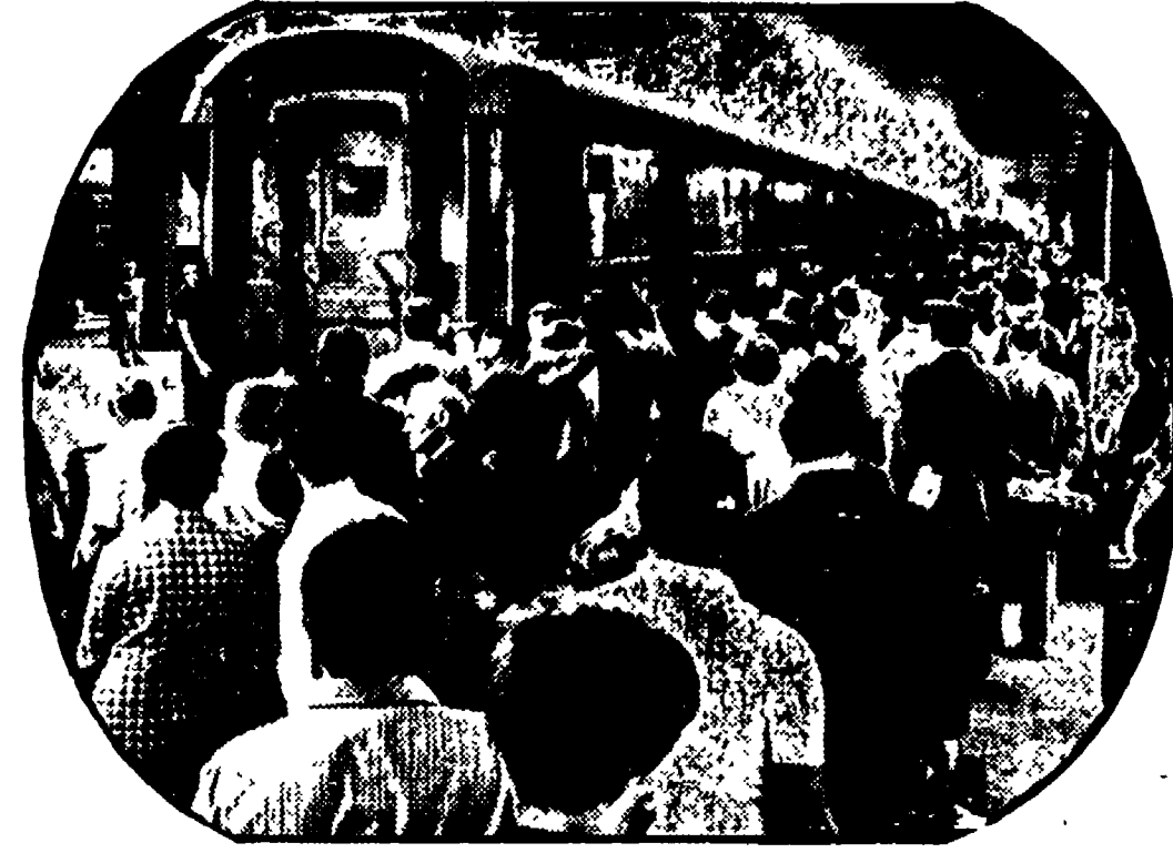
Ferrovie: durante i periodi di ferie al verificarsi ogni anno inintermittibili file di viaggiatori. Questi stessi problemi si ripresentano il sabato e la domenica.

Riformare l'intero sistema dei trasporti