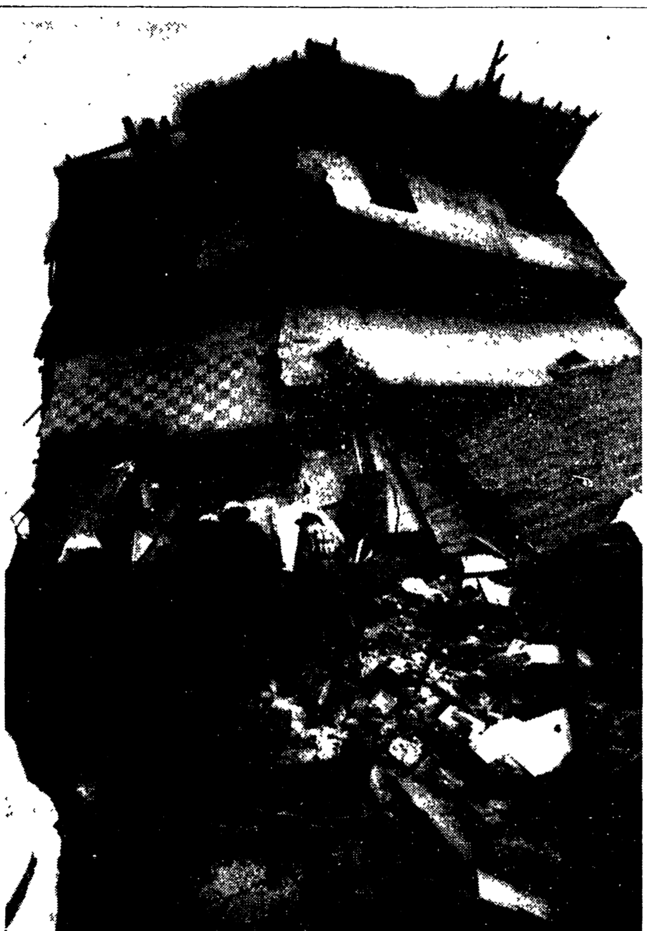
ESPLORAZIONE STABILE: 10 FERITI A COPENAGHEN. Un'esplosione di gas ha letteralmente sfasciato come un castello di carte un piccolo stabile a Ballerup...

La produzione di cereali passa da 168 a 215 milioni di tonnellate: una cifra record - Si conferma la tendenza a uno sviluppo regolare - Le ragioni del successo - Quattro direzioni di lavoro nella lotta contro le difficoltà naturali - Come si risponde all'esigenza di superare gli squilibri tra città e campagna