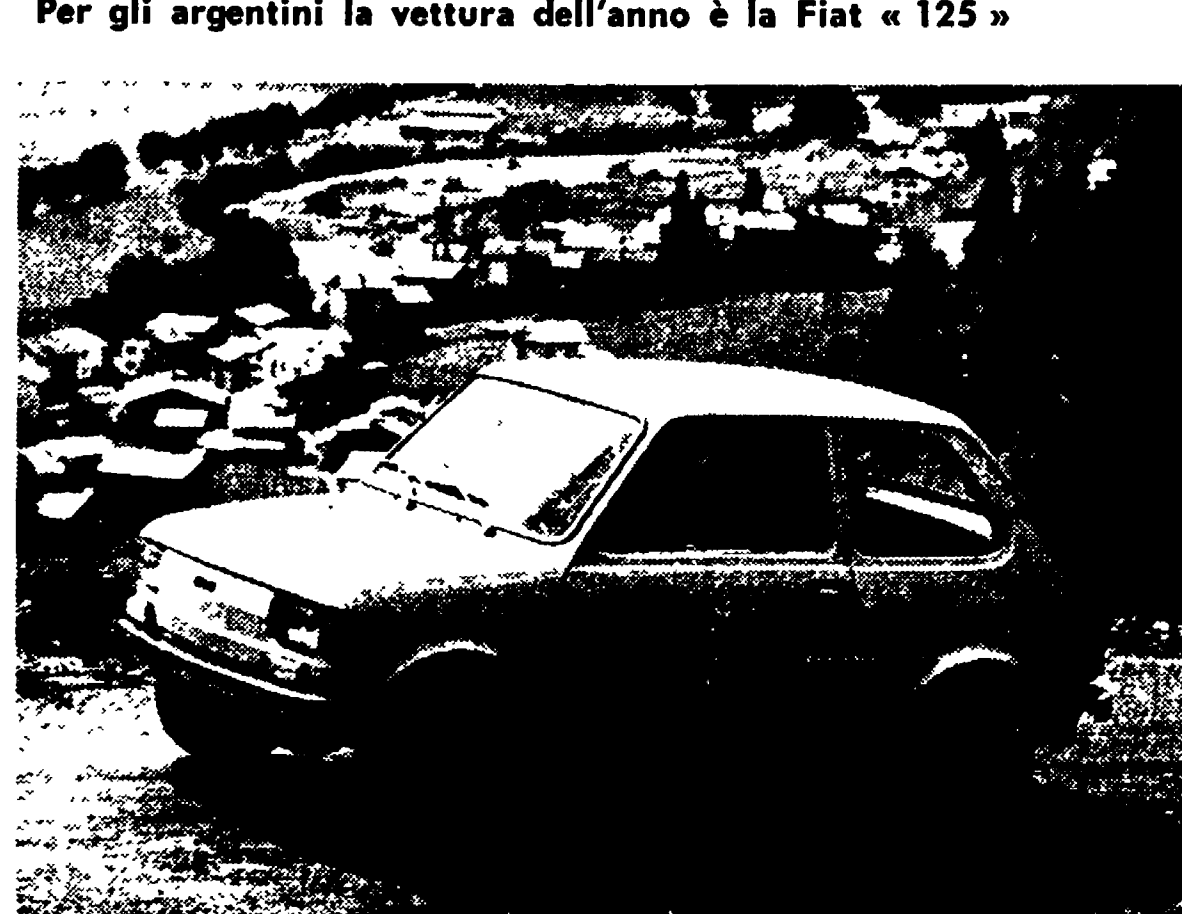
Le strade / Il traffico

Per gli argentini la vettura dell'anno è la Fiat «125»