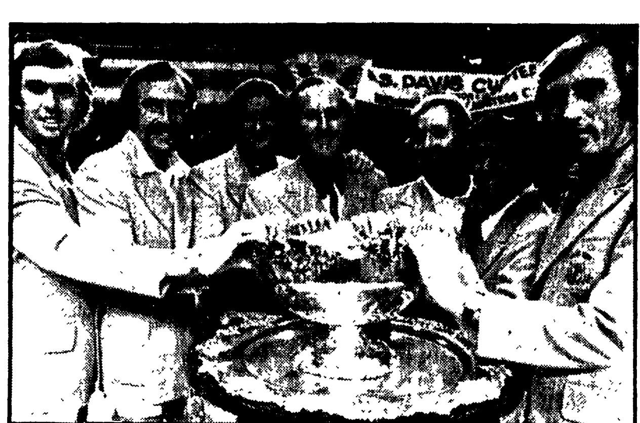
DAVIS: CAPPOTTO AGLI USA L'Australia ha inflitto un severo capofitto agli USA (5-0) nella finalissima della Coppa Davis...