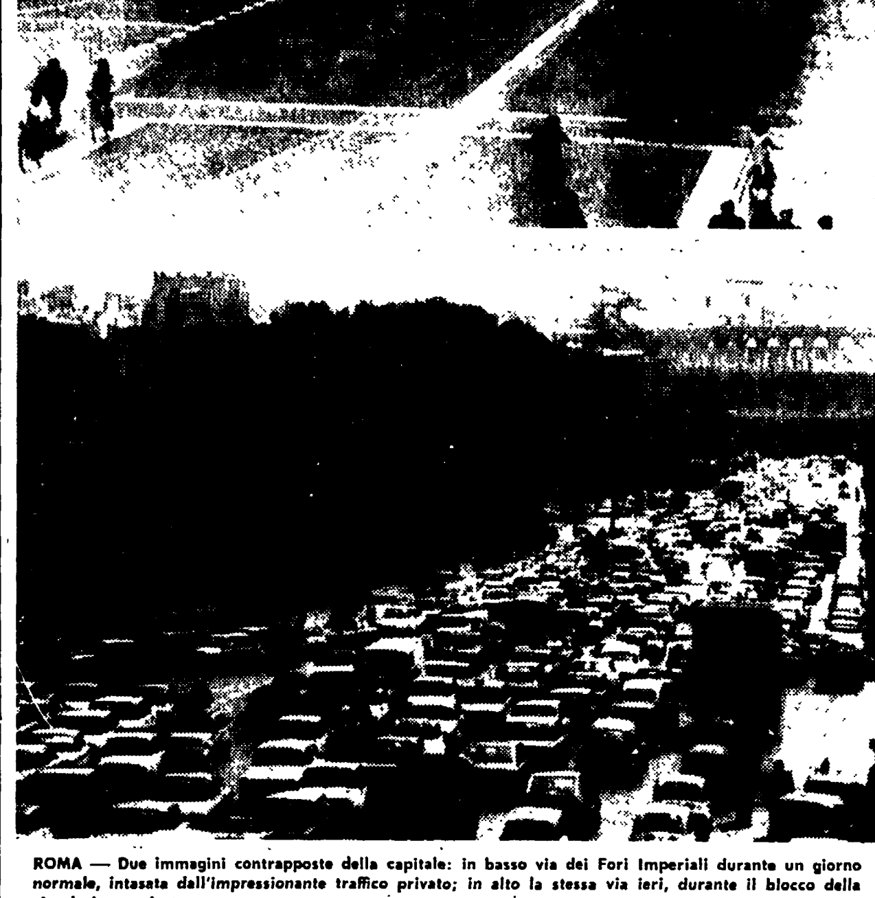
ROMA - Due immagini contrapposte della capitale: in basso via dei Fori Imperiali durante un giorno normale, intasata dall'impressionante traffico privato; in alto la stessa via ieri, durante il blocco della circolazione privata.

ne profusa a piene mani da chi vorrebbe rigettare sulle spalle dei lavoratori tutto il peso della cosiddetta austerità...»