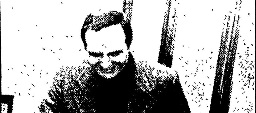
Linee telefoniche per la questura

di tempo brevissimi. Sul problema del razionamento si è ancora in una fase di posizione del sottosegretario alle Finanze Machiavelli il quale, confermando che il governo ha allo studio, appunto, misure di razionamento, che «potrebbe essere attuato eventualmente a primavera» ha affermato che le anticipazioni circa la quantità di benzina (72 litri) che verrebbe data in dotazione «sono da definire premature».