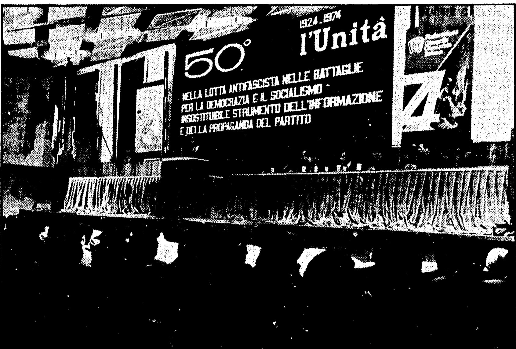
Un'immagine dell'incontro con i diffusori svoltosi ieri nel teatro della Federazione

Superati i 3 milioni e 470 mila copie - L'attività dei compagni nei posti di lavoro, nelle scuole e nei quartieri. L'intervento del compagno Tortorella - Ulteriori impegni per il Cinquantenario del quotidiano comunista