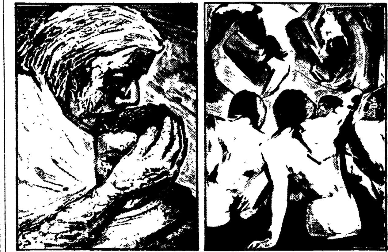
Due litografie che fanno parte del gruppo di opere donate da Siqueiros al Tribunale Russell