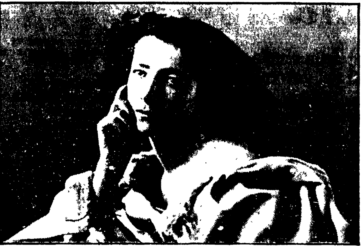
Sarah Bernhardt in un ritratto di Nadar