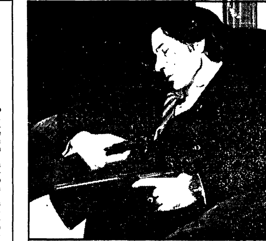
Il corpo dello sparatore PALERMO, 4