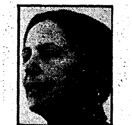
NILDE JOTTI — Referendum e responsabilità della DC