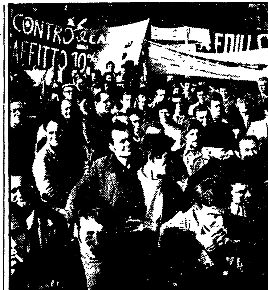
Migliaia di edili sono sfilati ieri in corteo

tutto antitetico al programma di sviluppo che il sindacato indica per ribaltare una situazione non più sostenibile.