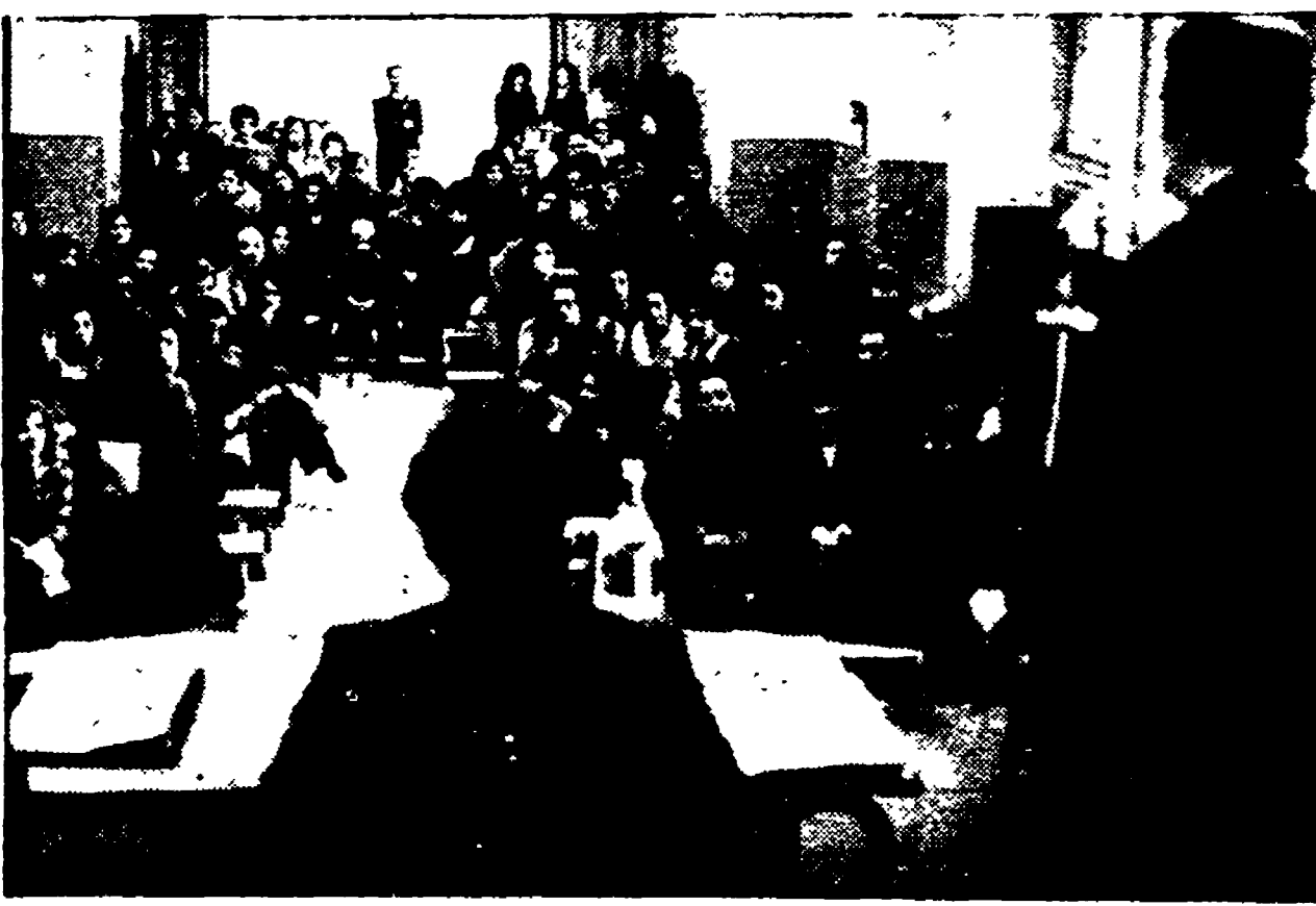
I docenti e il personale non insegnante di tutte le scuole, dalle materne all'ateneo, scendono oggi per sollecitare il governo a rispettare gli accordi a proposito dei decreti delegati sullo stato giuridico e perché cessino i ritardi nella applicazione dei « provvedimenti urgenti » per l'università.

Parlerà Bruno Storti - Corteo dall'università - Alla giornata di protesta partecipano i docenti e il personale non insegnante - Adesione dei comitati unitari degli studenti