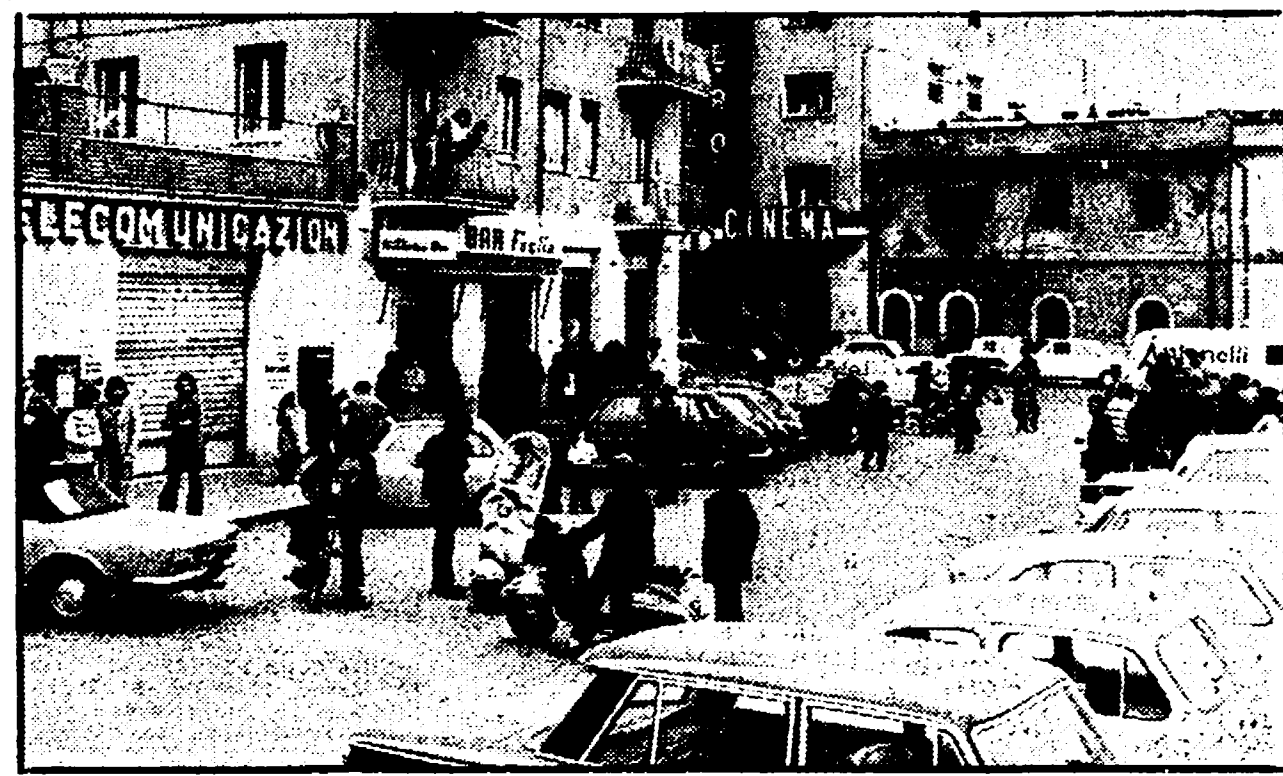
Il luogo dove è avvenuta la rapina

Il compagno Vetere sottolinea il valore delle lotte per la casa - Riconferma la delibera sul condono fiscale respinta dal comitato di controllo