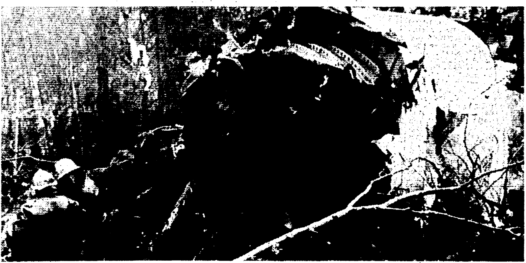
PARIGI - Un pezzo della fusoliera del DC 10 della Turkish Airlines precipitata nella foresta di Ermouville.