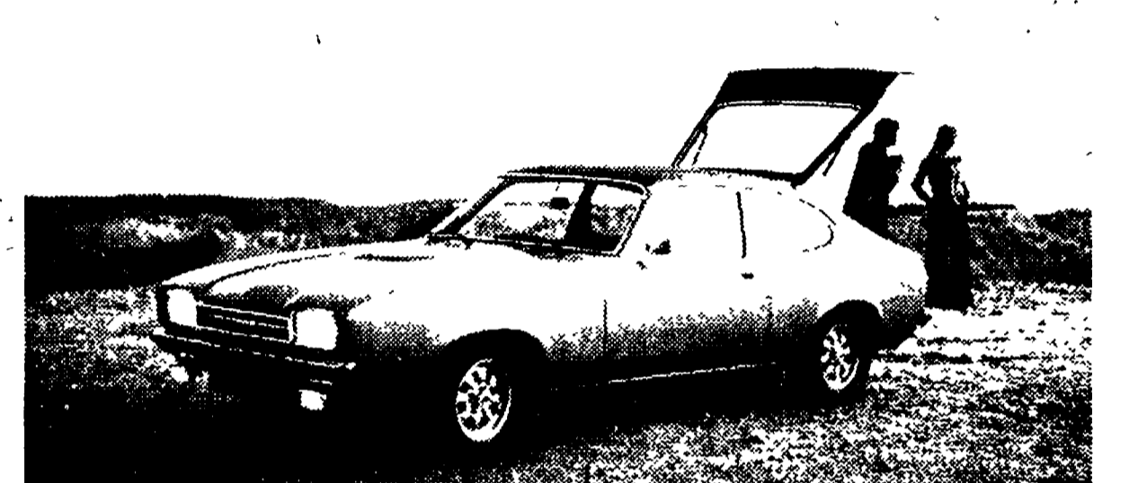
La Ford Capri II nella versione 1600 GT con portellone posteriore aperto. Si noti nella nuova versione l'essenzialità della calandra e della linea dei gruppi luce.