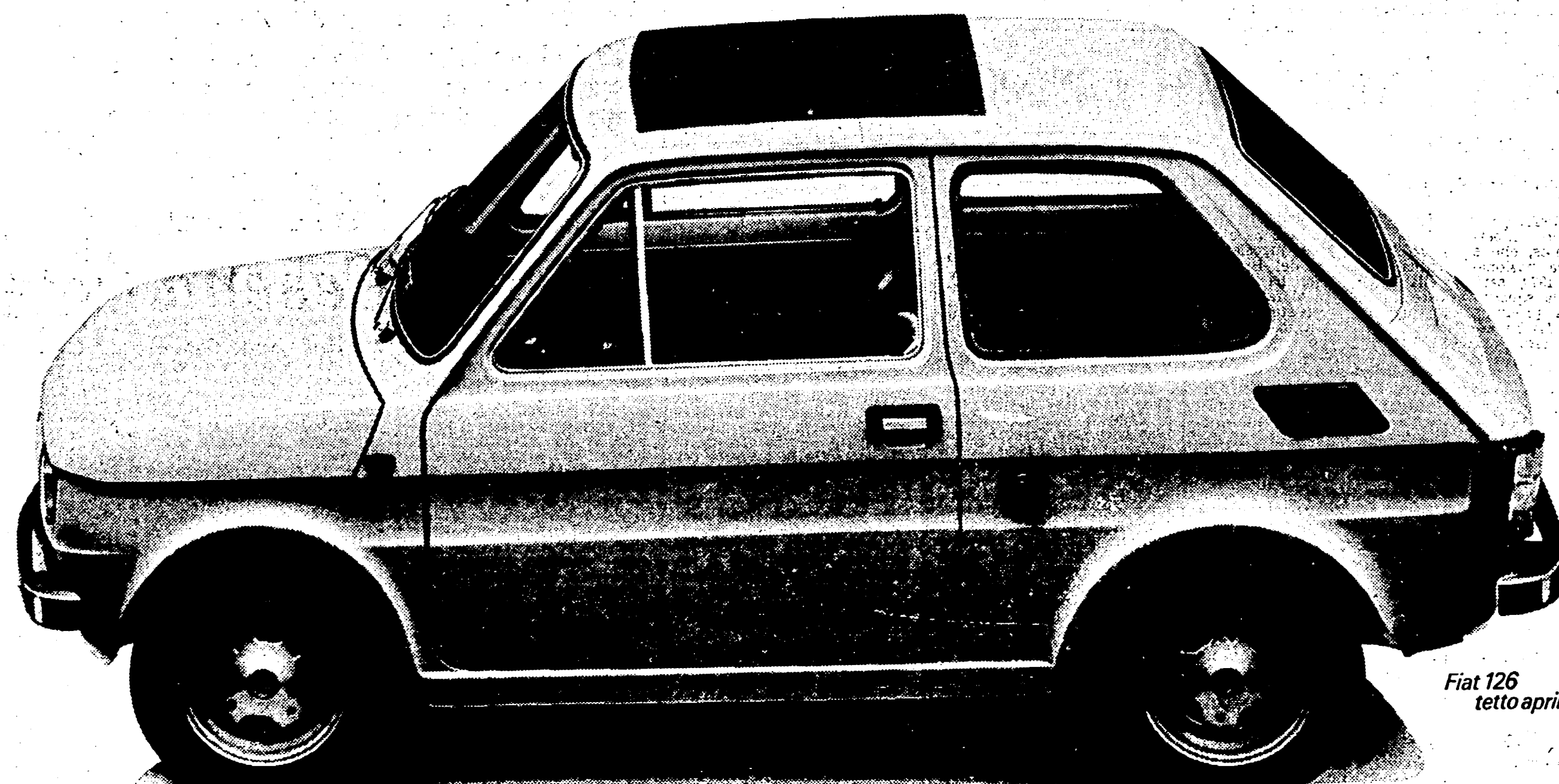
Fiat 126 tetto apribile

1936 - La Fiat costruisce la prima utilitaria ed è l'automobile alla portata di tutti 2 posti, motore 569 cm 3 , 13 CV, 85 km/h. Consumo: 16,6 km con un litro* Fiat 500 "topolino"