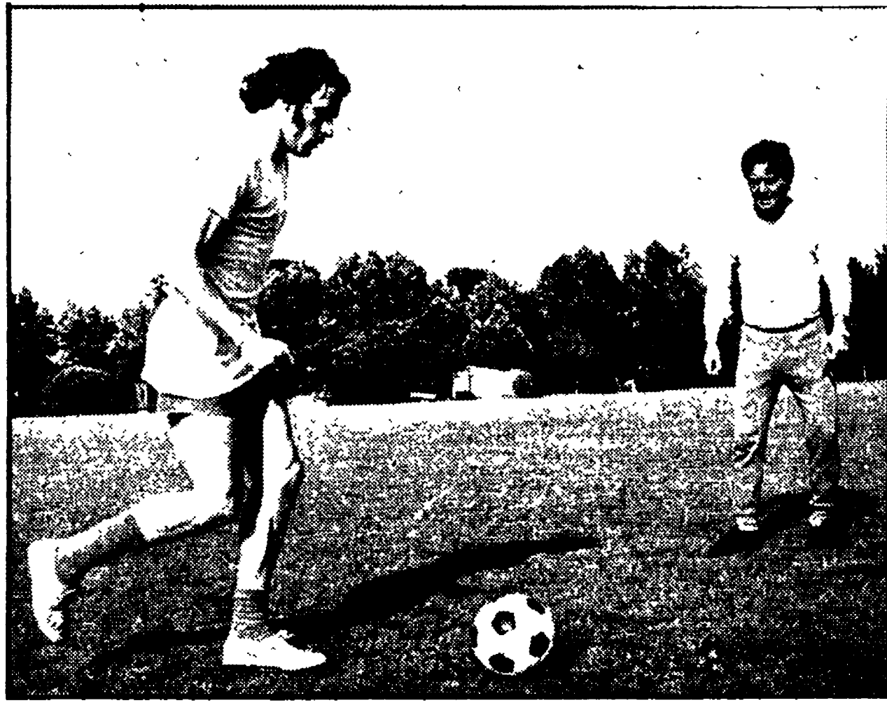
CHINAGLIA e MAESTRELLI durante un allenamento a Tor di Quinto