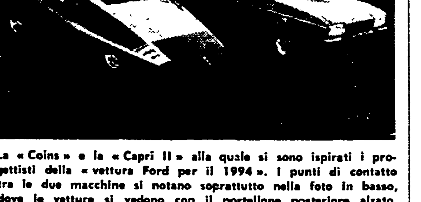
La «Coins» e la «Copri II» alla quale si sono ispirati i progettisti della vettura Ford per il 1994. I punti di contatto tra le due macchine si notano soprattutto nella forma in basso, dove le vetture si vedono con il portellone posteriore alzato.

Entro aprile interamente aperta l'autostrada del Brennero