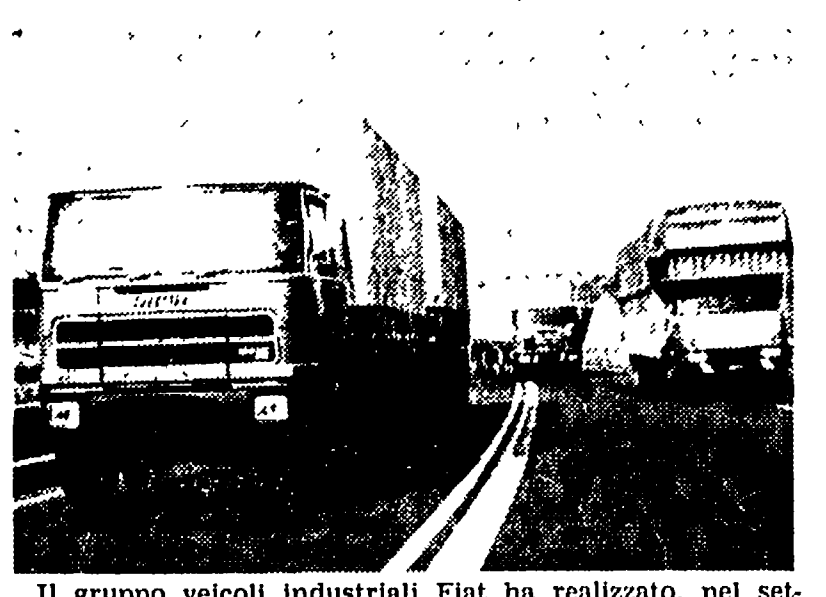
Il gruppo veicoli industriali Fiat ha realizzato, nel settore del trasporto pesante su strada, un nuovo modello a tre assi, denominato «180 6x2», che si affianca con caratteristiche di impiego superiori al modello «691».

La polemica sui palloni autogonfiabili anti-urto di cui, per decisione delle autorità federali americane, ogni automobile dovrà essere munita negli USA a partire dai modelli 1977, è stata ravvivata da un gruppo di esperti della General Motors chiamati a deporre dinanzi alla commissione commercio del Senato, che alla luce delle proteste dell'industria di Detroit, sta dibattendo la questione.