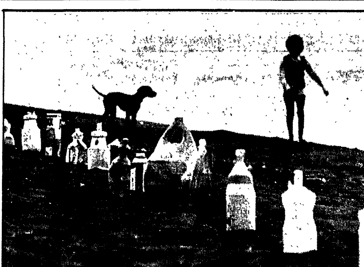
Marl e coste abbondano di contenitori di plastica abbandonati. Nella foto si vede un bambino che si è divertito a mettere in fila questi «vuoti» indistruttibili. Ne è venuta fuori una immagine emblematica della situazione in cui si trovano le coste che si affacciano sul mar Mediterraneo