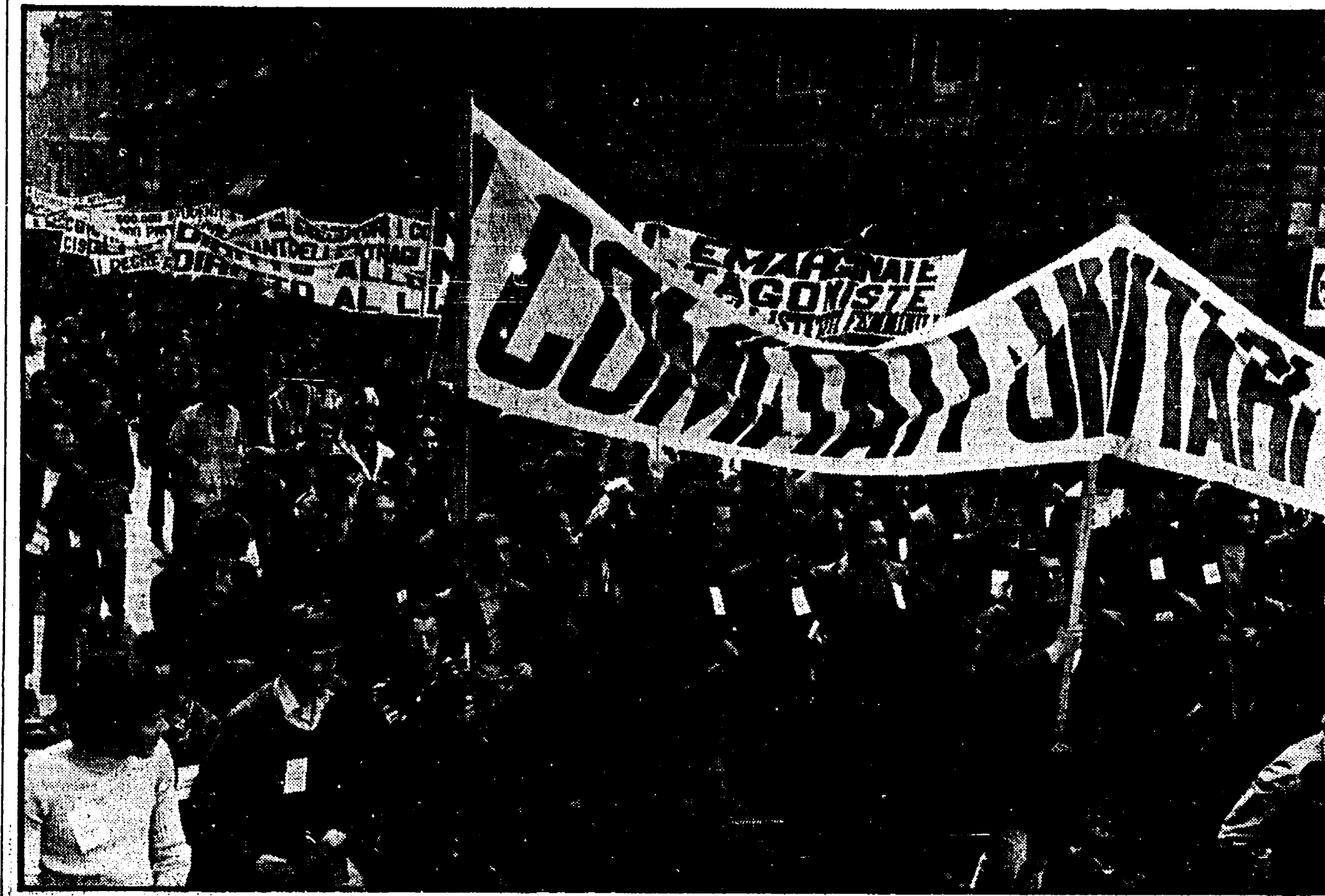
Il corteo dei comitati unitari degli studenti medi attraversa le vie della città. A destra: un particolare della manifestazione