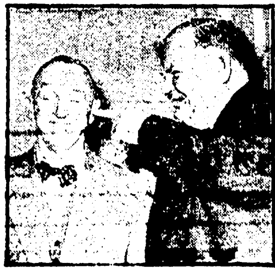
Nella foto: Stan Laurel e Oliver Hardy, protagonisti del film «Muraglie» che va in onda domenica.

La scorsa settimana, i programmatori mandarono in onda un primo canale con giusta tempestività, una volta tanto un dibattito sulla figura di Pompidou e sulla crisi aperta in Francia dalla sua scomparsa. Per far posto a questa trasmissione, fu rinviata l'ultima puntata del ciclo Le Americhe nere, che è stata recuperata mercoledì scorso; ma in seconda serata e in alternativa ad una trasmissione di richiamo come la telecronaca diretta della partita di calcio Milan-Borussia. Le conseguenze dello spostamento non sono difficili da valutare, anche senza disporre di dati statistici precisi: l'ascolto di questa ultima puntata di Le Americhe nere (per alcuni versi la migliore di un ciclo già di per sé interessante) avrà automaticamente perduto una parte rilevante di potenziali spettatori.