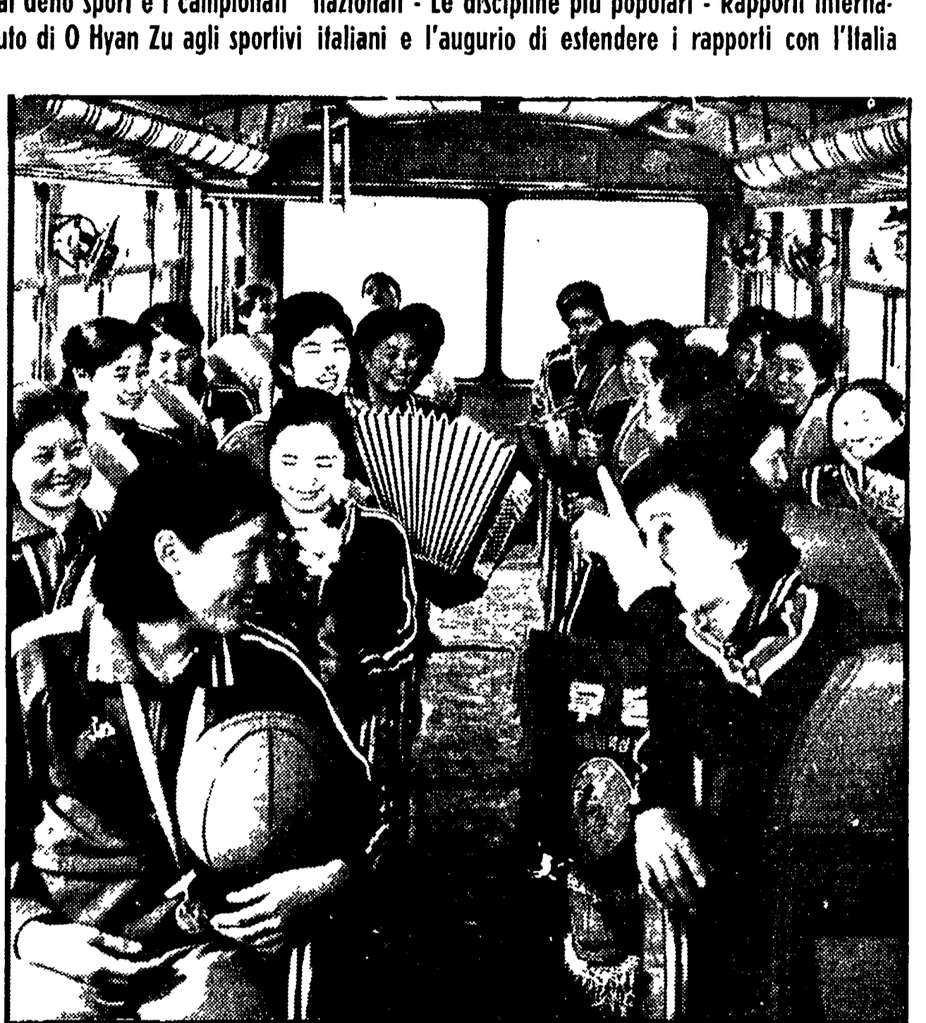
Le ragazze della squadra di basket «Pyongyang» si recano al campo di allenamento

La tournée del «sempio» azzurri del calcio nella Repubblica Popolare Democratica di Corea è risultata una esperienza interessante e positiva sotto ogni aspetto per i dirigenti della Federazione, per il gruppo di turisti al seguito della comitiva azzurra e per i 18 giocatori (la maggioranza dei quali iscritti all'Università o già diplomati).