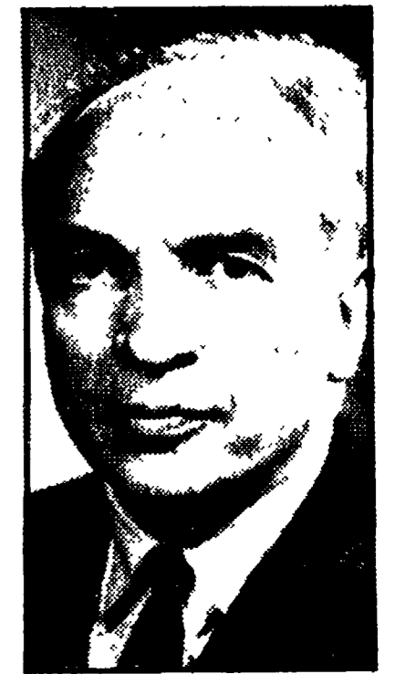
g. b. Alfred Sauvy