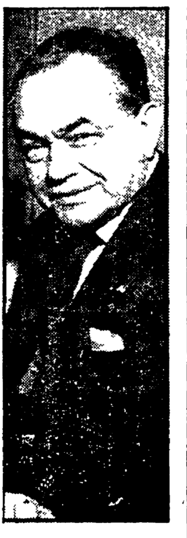
Edward G. Robinson