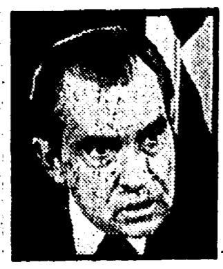
NIXON. L'ipotesi si avvera.

Al termine di una settimana nella quale l'attentato Watergate ha registrato nuovi colpi di scena, il meccanismo della messa in stato d'accusa (impeachment) del presidente Nixon si è messo ufficialmente in marcia.