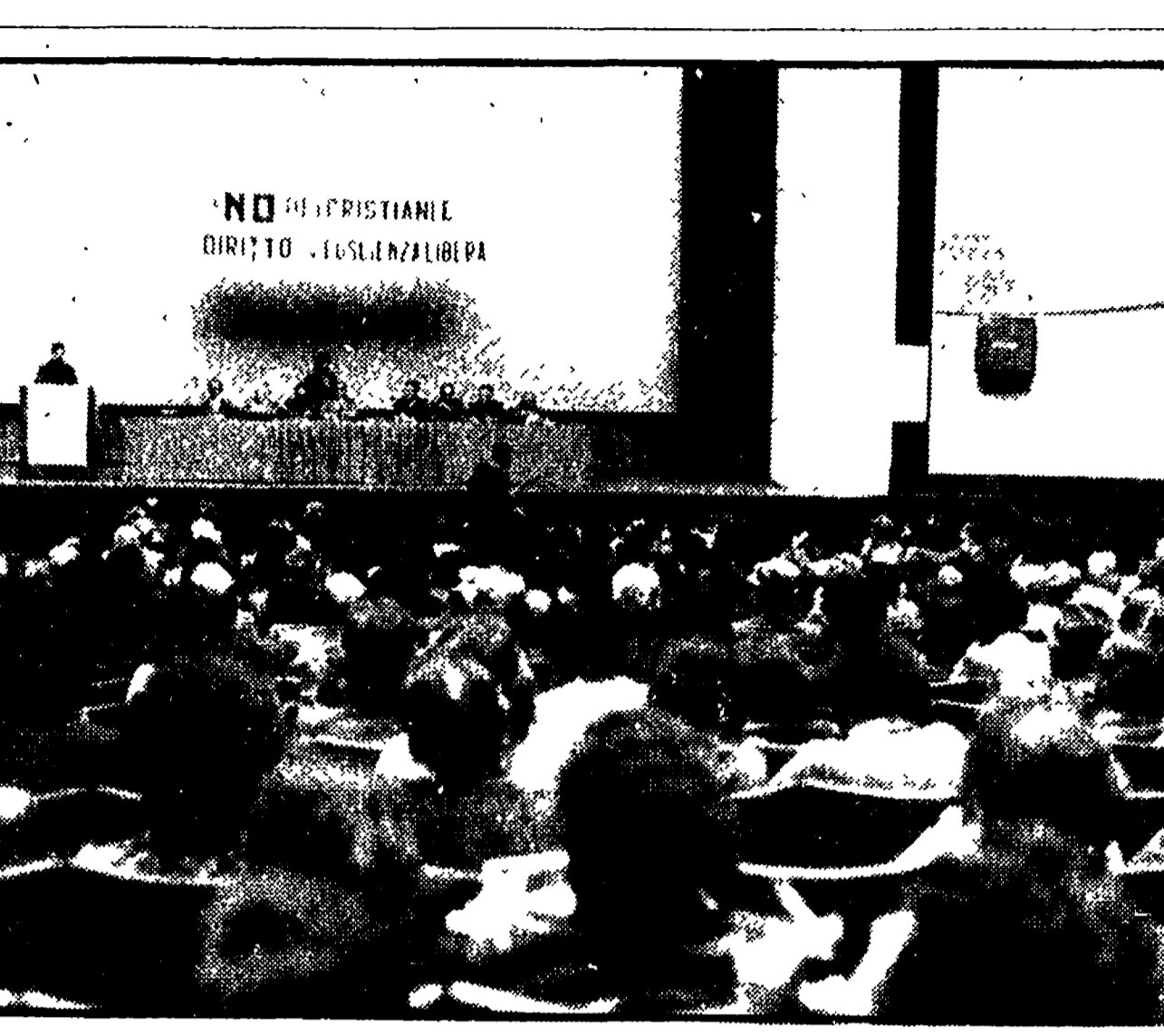
La manifestazione dei cattolici democratici per il NO al cinema Brancaccio