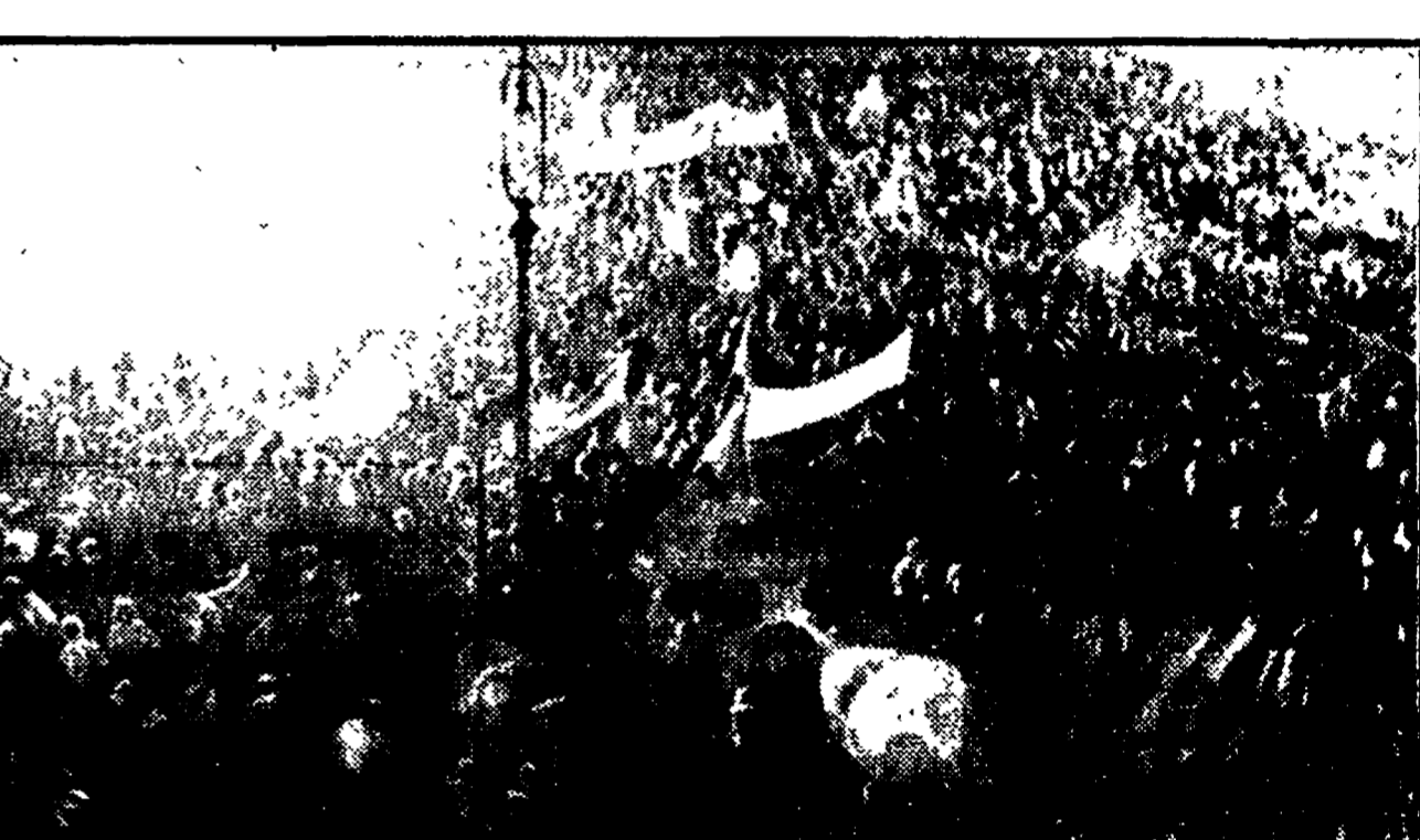
La folla di cittadini, lavoratori, giovani e donne che si è riunita a piazza Navona per festeggiare la vittoria del NO