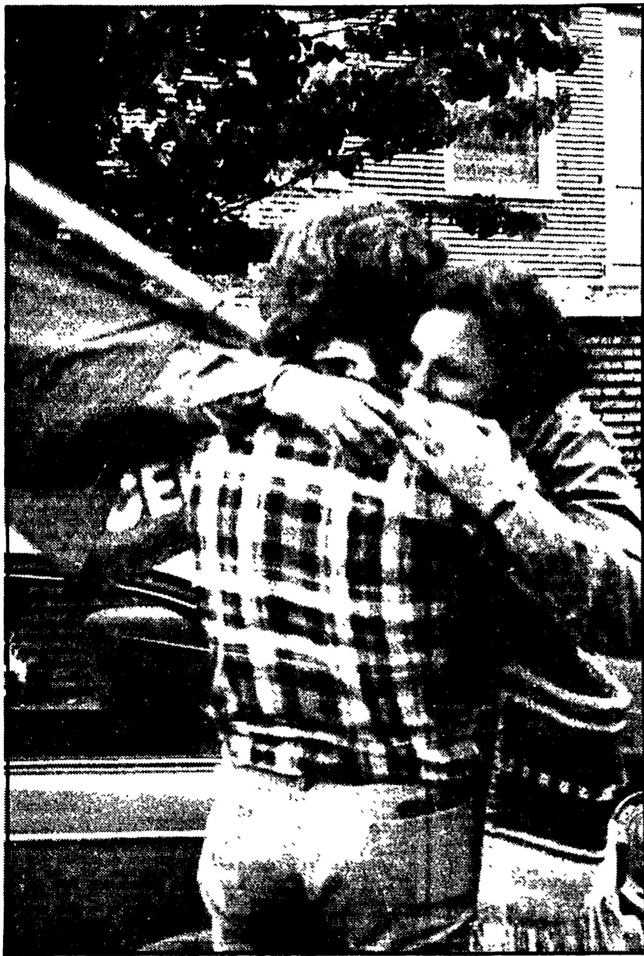
L'abbraccio di due giovani esultanti subito dopo l'annuncio della vittoria dello schieramento divorzista che a Roma ha riportato oltre il 68% dei voti, superando del 17% i risultati delle elezioni politiche del 1972 e del 9% la media nazionale

Fin dal pomeriggio la gente si è riversata per le strade - Entusiasmo e applausi davanti alle sedi della direzione del PCI, della Federazione romana e dell'«Unità» - Una grande folla ha manifestato da piazza Navona a Porta Pia - Fiaccolata sotto la redazione del «Messaggero» - I romani hanno festeggiato la vittoria fino all'alba in tutti i quartieri