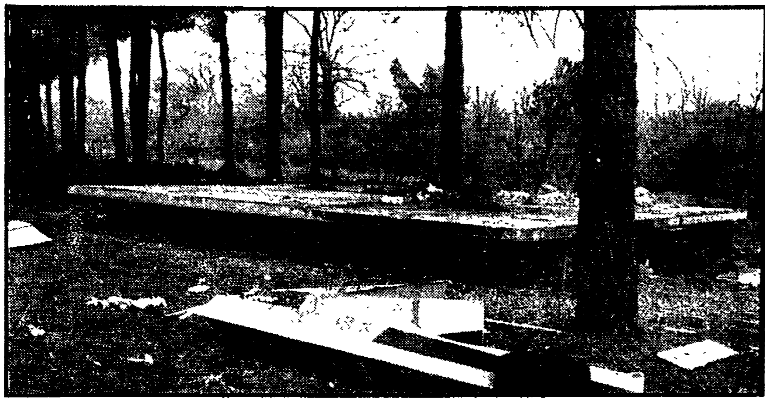
I lavori di una villa abusiva a Capocotta interrotti da una ordinanza del pretore