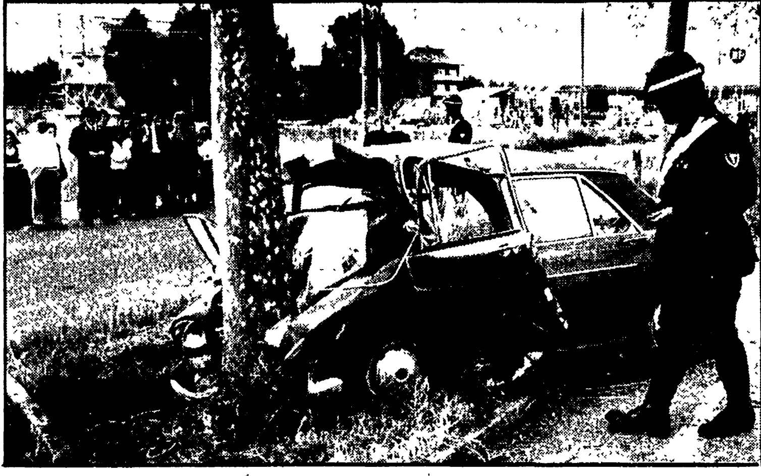
L'auto che si è schiantata contro un albero sulla Via del Mare, all'altezza di Acilia.