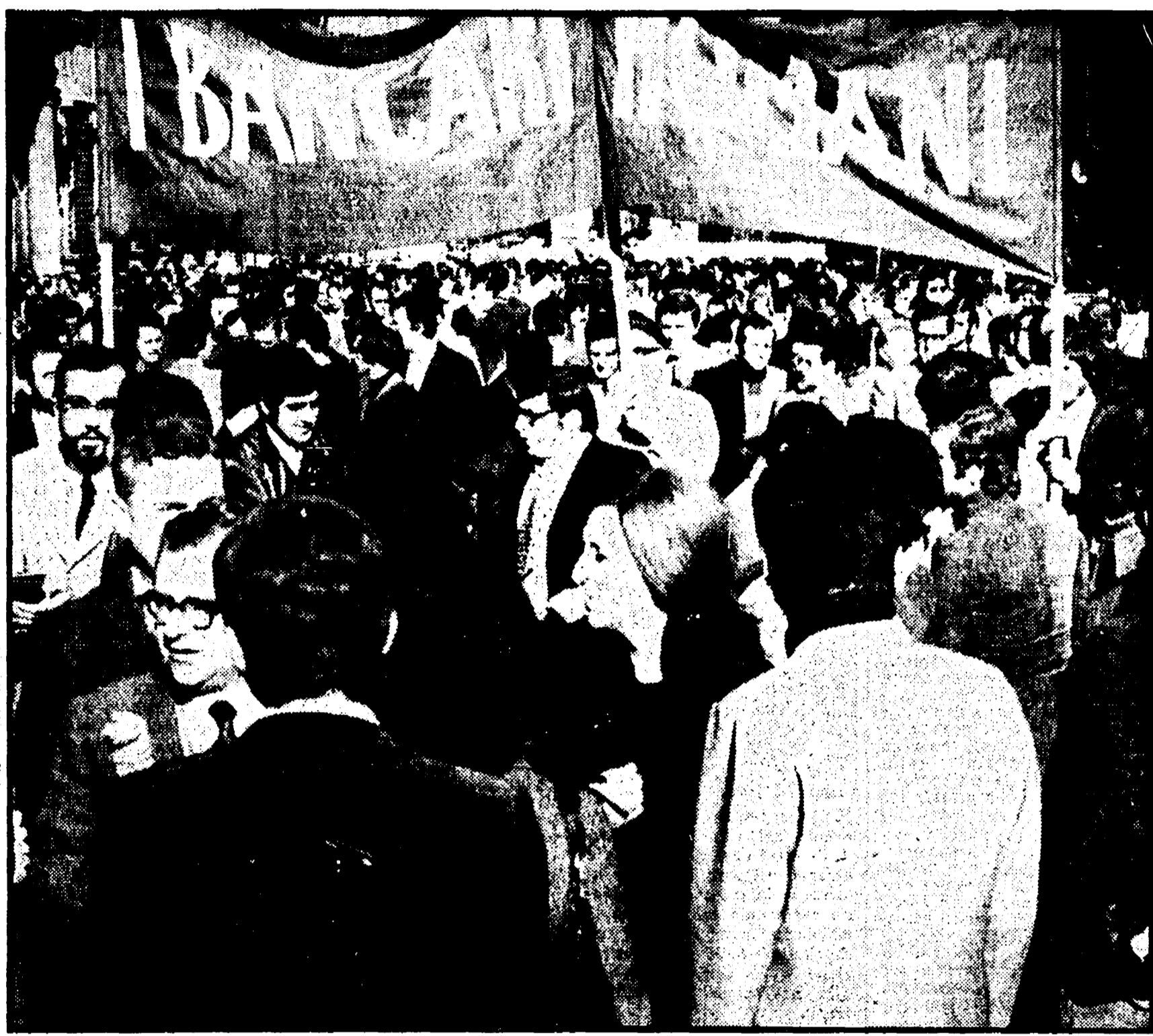
Una manifestazione di bancari romani

Dal '69 a oggi i sindacati confederali hanno registrato un grande incremento nelle iscrizioni. Va incrinandosi l'atteggiamento corporativo - Addetti a uno dei punti nevralgici del potere economico ne ignorano i meccanismi - La richiesta di consapevolezza del proprio lavoro